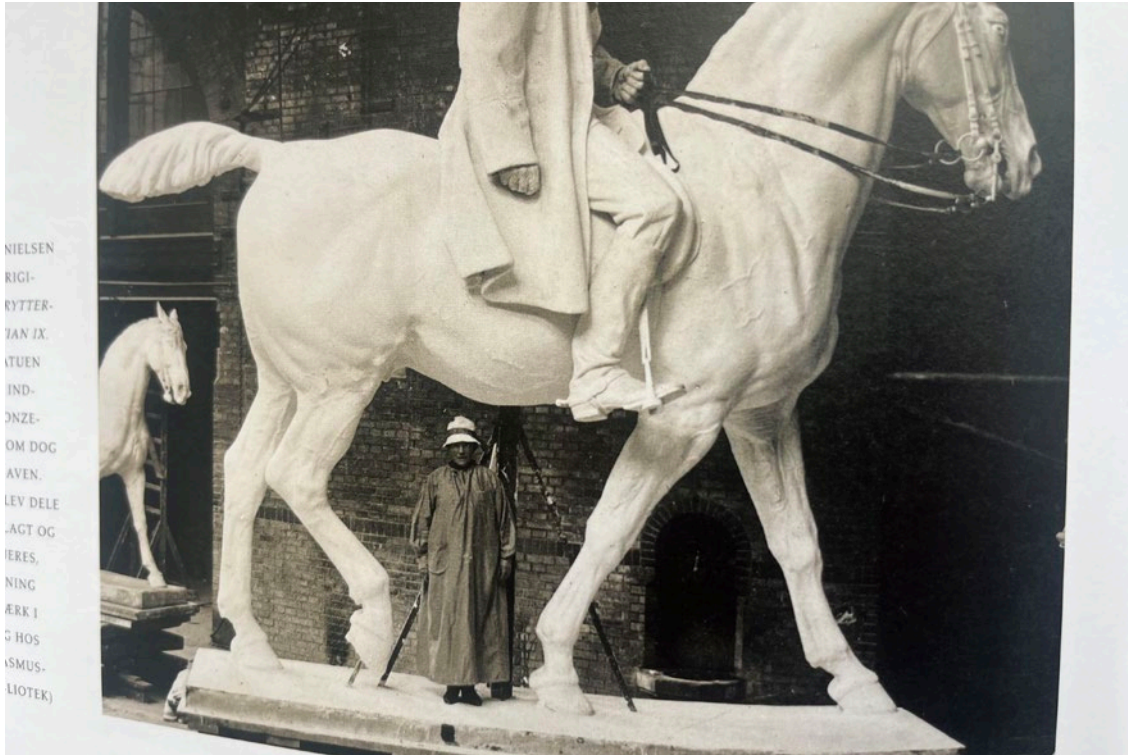
Anne Marie Carl-Nielsen under gipsmodellen af Christian IX rytterstatue, 1924